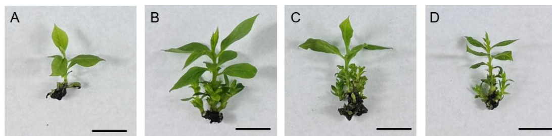
A. 继代培养所使用的高度为 1.5 cm 左右的 L938 组培苗；B~D. 30 d 统计时，1/2MS (B)、(1/2N) MS (C)、1/4MS (D) 中组培苗的生长状态，标尺=1 cm。

图 2 为君迁子优系 L938 组培苗在不同继代培养基中的生长状态，可以看出 1/2MS（图 2-B）中组培苗的植株高度以及生长状态明显优于（1/2N）MS（图 2-C）和 1/4MS（图 2-D）。表 3 结果显示，组培苗在 1/2MS 和（1/2N）MS 中新梢增殖系数无明显差异，但均显著高于 1/4MS；在一级新梢数方面，1/2MS 显著高于 1/4MS，（1/2N）MS 和 1/4MS 差异不显著；二级新梢数与一级新梢数结果相同；三个处理间的三级新梢数无显著差异。试验结果表明：1/2MS 培养基较适宜进行君迁子 L938 组培苗的继代培养，新梢增殖系数达到了 4.40。