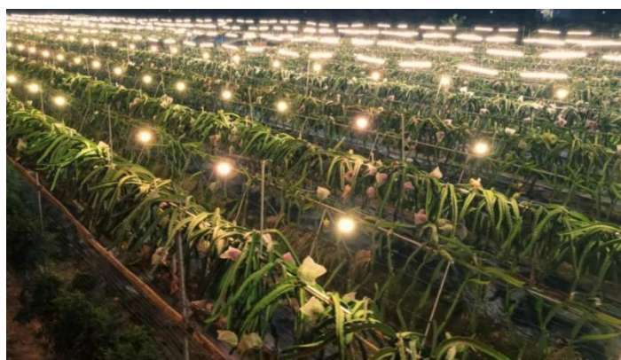
图 1 LED 灯在火龙果中的应用

发光二极管（LED）以其光谱范围广、波长特定、效率高、散热少、寿命长、功率小等优势，逐渐广泛应用于农业生产中，以改善作物生长，提高产量和品质 [12] ，如图 1 所示，为 LED 灯在火龙果生产上的应用。LED 灯可以发出多种单波长的光，也可以发出多波长组合的白光或其他类型的混光 [13] 。与其他光源相比，LED 灯光效显著提升，白炽灯、卤钨灯的光效为 12 lm/w~24 lm/w，荧光灯的光效为 50 lm/w~70 lm/w，钠灯的光效为 90 lm/w~140 lm/w，且大部分的耗电变成热量损耗，而 LED 灯的光效经改良后可达到 50 lm/w~200 lm/w。在同样的照明效果下，LED 灯的耗电量是白炽灯的八分之一，荧光灯的一半。LED 灯体积小、质量轻，用环氧树脂封装，可承受高强度机械冲击和震动，不易破碎，使用寿命可达 5~10 年。LED 灯为全固态发光体，属于冷光源，发热量低，无热辐射，且不含汞、钠元素等可能危害环境和人体健康的物质，废弃物可回收，没有污染 [14] 。