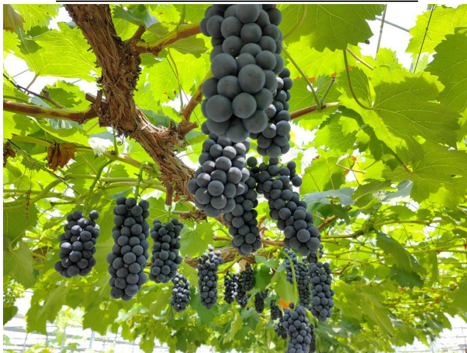
图 3 南太湖特早果实挂树情况