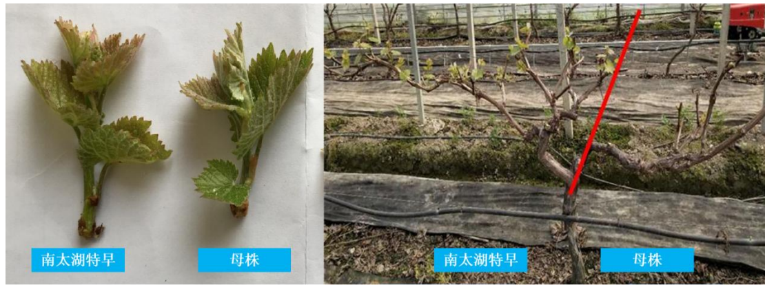
图2 南太湖特早与母株生物学形状对比