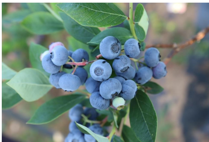
图1 蓝莓新品种珍珠蓝