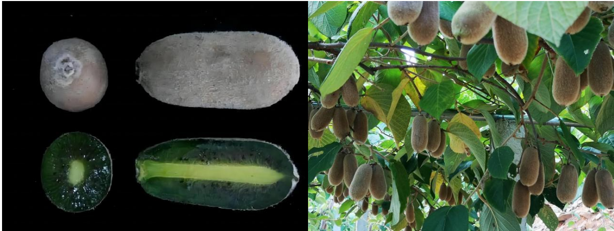
图 1 毛花猕猴桃新品种甜华特果实